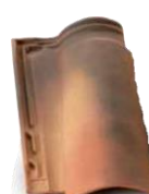
corte a sera