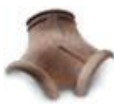
вальмовая трехконечная черепица