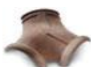
вальмовая трехконечная черепица