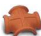
вальмовая четырехконечная черепица