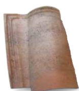
corte d aragona