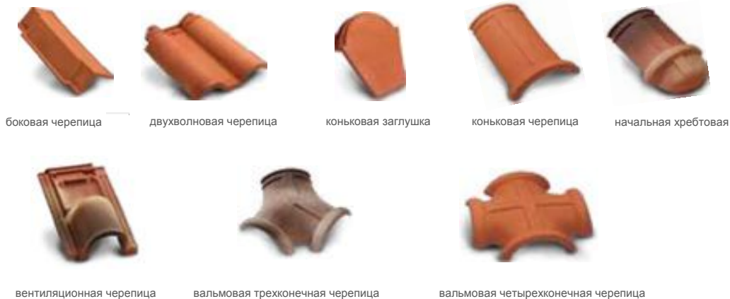
боковая черепица двухволновая черепица коньковая заглушка коньковая черепица начальная хребтовая вентиляционная черепица вальмовая трехконечная черепица вальмовая четырехконечная черепица