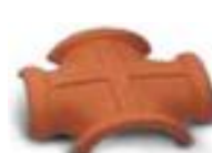
вальмовая четырехконечная черепица