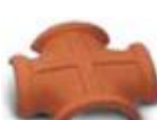
вальмовая четырехконечная черепица